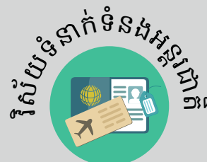
វិស័យទំនាក់ទំនងអន្តរជាតិ