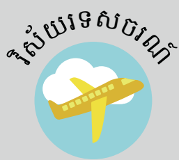
វិស័យទេសចរណ៍

វិស័យដែលមានត្រូវការ អ្នកនិយាយពីភាសាជា អាទិភាពមានដូចជា: