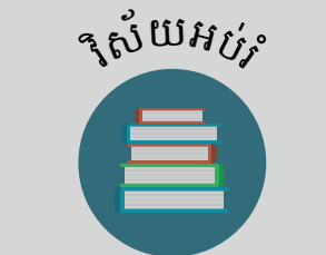
វិស័យអប់រំ