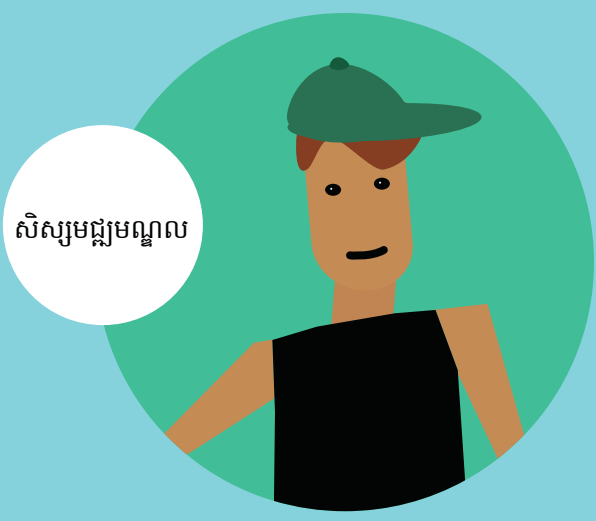
សិស្សមជ្ឈមណ្ឌល

សិក្សាច្រើនទៅលើជំនាញមុខ វិជ្ជាជីវៈជាពហុភាសានៅតាម សាលារៀន សិក្សាភាសា បរទេស និងពង្រឹងភាសាកំណើត កាន់តែល្អប្រសើរ