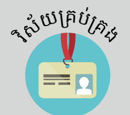
វិស័យគ្រប់គ្រង