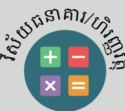
វិស័យធានាការ/ហិរញ្ញវត្ថុ