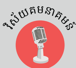
វិស័យគមនាគមន៍