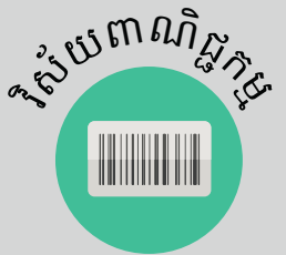
វិស័យពាណិជ្ជកម្ម