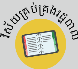
វិស័យគ្រប់គ្រងវដ្តជីវិត

បុគ្គលិកបម្រើការងារ ដែលចេះនិយាយច្រើន ភាសាទទួលបានប្រាក់ បៀវត្សរ៍ច្រើនជាងបុគ្គលិក បម្រើការងារដែលនិយាយ តែមួយភាសាពី៥ភាគរយ ទៅ២០ភាគរយ